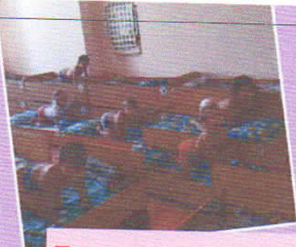
Бодрящая гимнастика после сна